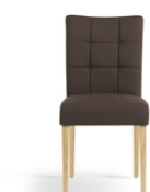
CARRE HD -A